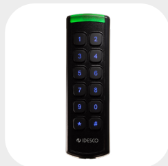
VS PIN 148 x 45 mm G: 25 mm z kablem, 25 + 10 mm ze złączem