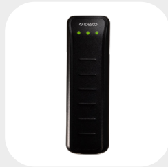
SLIM 141 x 43 x 19 mm