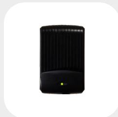
DESKTOP 95 x 62 x 24 mm