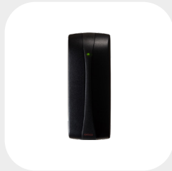
BASIC 110 x 43 x 24 mm