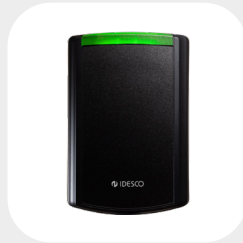
VM 126 x 85 mm G: 28 mm z kablem, 28 + 9 mm ze złączem