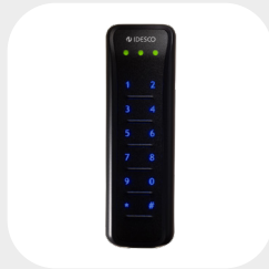
SLIM PIN 141 x 43 x 19 mm