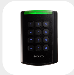
VM PIN 126 x 85 mm G: 28 mm z kablem, 28 + 9 mm ze złączem