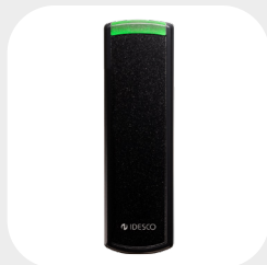
VS 148 x 45 mm G: 25 mm z kablem, 25 + 10 mm ze złączem