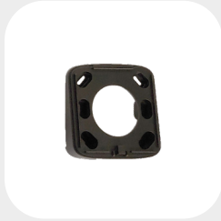
QUATTRO 10° 87 x 86 x 27 mm