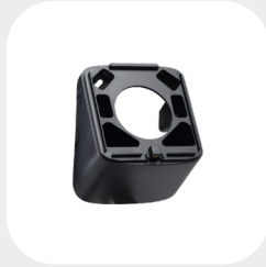
QUATTRO 33° 105 x 90 x 48 mm