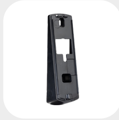
VS 10° 154 x 48 x 30 mm