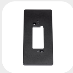
LARGE 170 x 80 x 10 mm