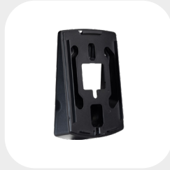
VM 10° 130 x 87 x 26 mm