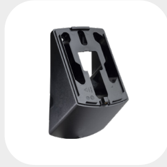
VM 33° 157 x 94 x 72 mm