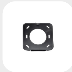
QUATTRO 87 x 87 x 7 mm