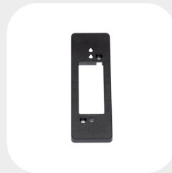
SLIM 140 x 44 x 11 mm