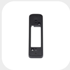
SMALL 140 x 49 x 10 mm