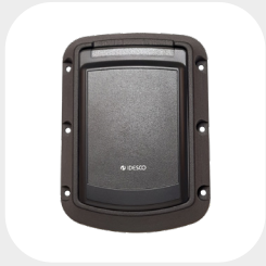
ISKUSUOJA 160 x 118 X 30 mm