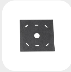
QUATTRO 93 x 93 x 1 mm